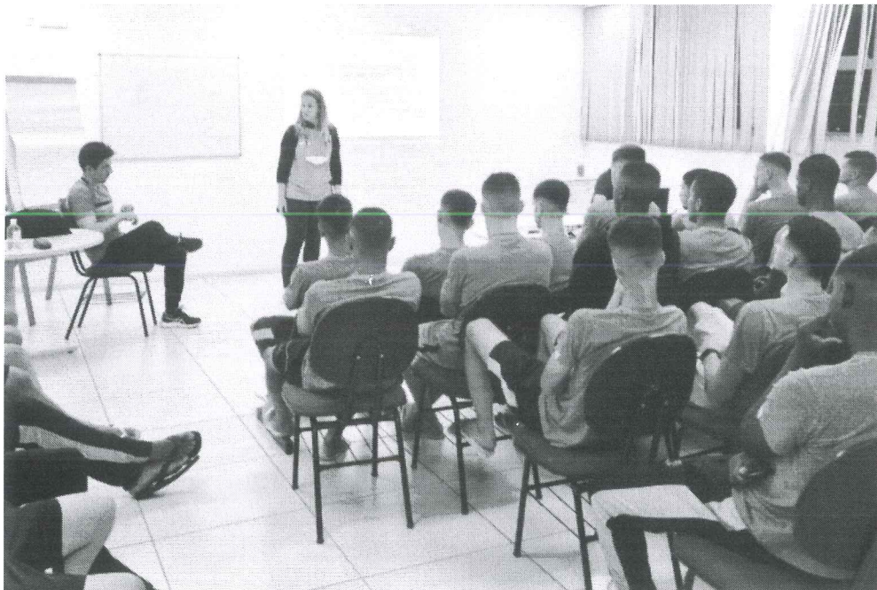
Atividade em grupo com a equipe da Categoria SUB- 17 - Preparação Mental.